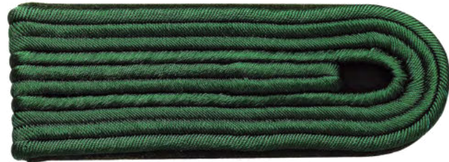
63119/ 4-streifig 63124/ 3-streifig 63122/ 2-streifig