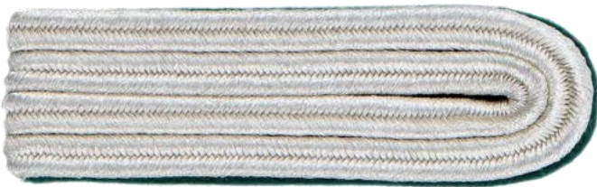
63117/ 4-streifig 63120/ 3-streifig 63121/ 2-streifig