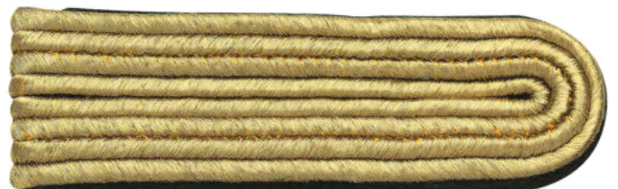
63118/ 4-streifig 63122/ 3-streifig 63123/ 2-streifig